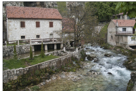
Bistrica u Livnu