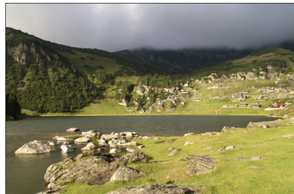
Jezero je Prokoško