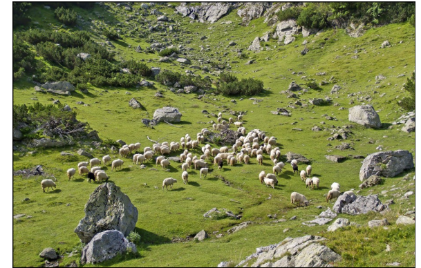
Na ispašu 2