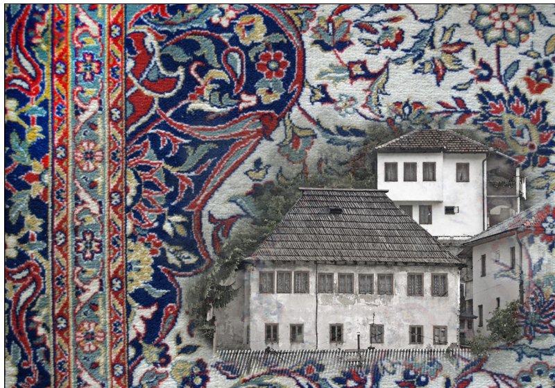
Motivi iz Travnika