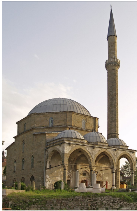
Kalaun Jusuf pašina džamija - Maglaj