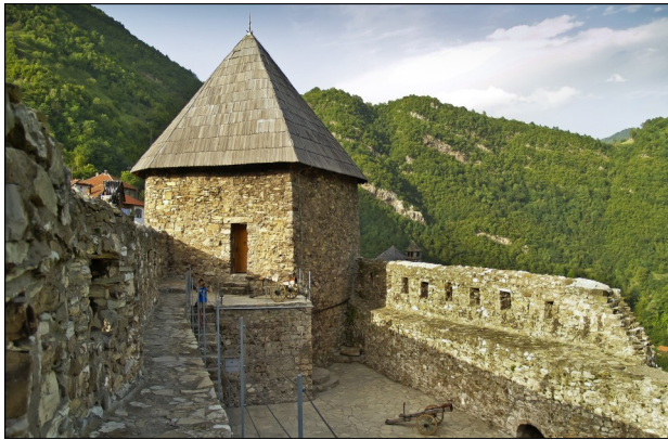
Kula u Vranduku